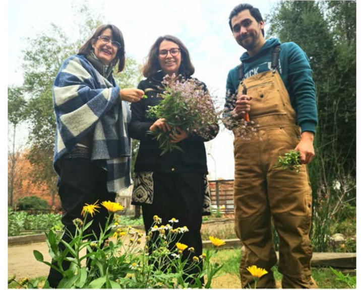
Oficina Verde Programa Valores UC

La plataforma web ha sido una herramienta útil que aporta considerablemente al registro de acciones y hábitos sustentables, requiere de un acompañamiento inicial de inducción cercana, donde la comunicación directa y permanente es clave para completar la gestión.