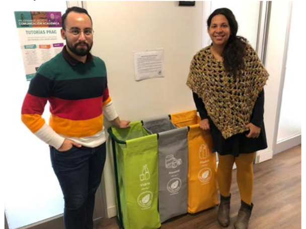
Oficina Verde Programa de Lectura y Escritura Académica