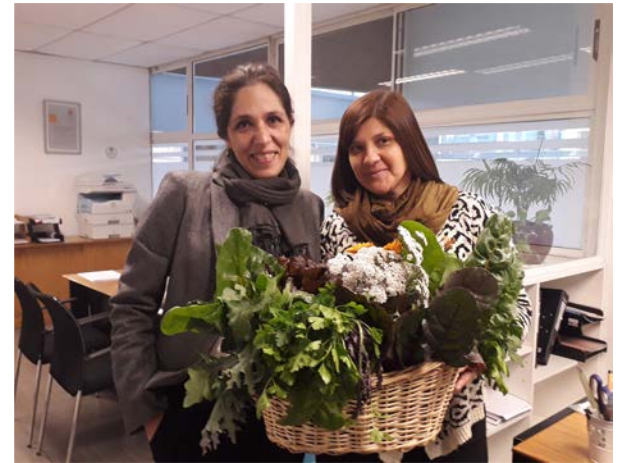
Oficina Verde Administración Campus San Joaquín

*Las oficinas de Administración de todos los campus también funcionan como oficinas verdes.