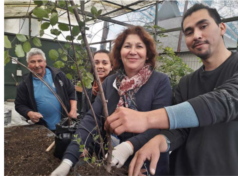
Oficina Verde Biblioteca de Teología